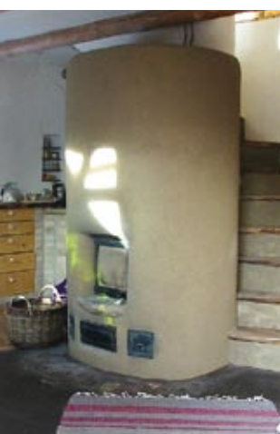
▲ Minimasseovnen er husets hjerte.

◀ Den færdige trappe med trin af elmeklær. Til venstre i billedet ses masseovn og skorsten.