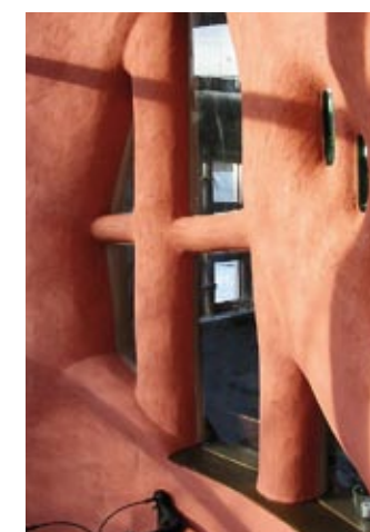
▲ Solvæggen er finpudset med et tyndt lag amerikansk lerpuds.

MICHAEL G. SMITH: Cobber's Companion . Cob Cottage Company Publication, 1997 IANTO EVANS, MICHAEL SMITH OG LINDA SMILEY: The Hand-Sculpted House: A Practical and Philosophical Guide to Building a Cob Cottage: The Real Goods Solar Living . Chelsea Green Publishing Company, 2002 Lerjord som byggemateriale . En vejledning udarbejdet af Tegnestuen Vindrosen, 1993. www.vindrosen.dk/lerjord.html